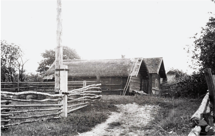
Joonis 5. Vaade Süllätüväle. Foto: Paulopriit Voolaine, 1960-ndad. (ERM Fk 1508: 96)

(SSR: 200). Toponüümi puhul jääks lahtiseks silbi to algupära. Venekeelne toponüüm Шымово kajastab samuti mitte eriti positiivset tegelast. See läh- tub apellatiivist уым 'narr; naljamees; mitmesugused müütilised tegelased, nagu majavaim, veehaldjas, metsahaldjas, näkineiu', vrd 1677 Илюшка Шымов ; usundilisel juhul täidaks nimi kaitsefunktsiooni (Truusmann 1897: 88; SDL: 848; SNL: 624). Tõenäoliselt on š-häälikut sisaldav Shülätüvä tekkinud kas Šutovo mõjul või on see jäänud sisihäälikuga nimekujust. Larüngaalklusiili esinemine Süllätüvä nimevariantis Sülädä 9 võib seostuda lõpuosa lühenemisega, kuid Mõiza ja Seipolo (vt eespool) puhul jääb see arusaamatuks, kui mitte oletada alateadvuslikku hääldamist mitmusliku lõpuna vene keele eeskujul. (Vt joonis 5)