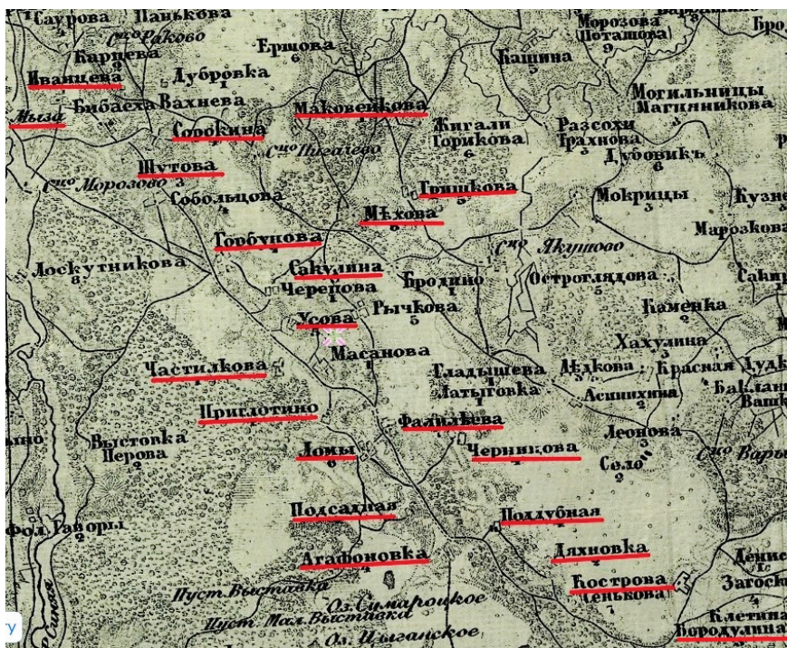
Joonis 2. Kraasna keeleala külad (punasega alla joonitult) Vene impeeriumi lääneosa kolmeverstasel kaardil aastast 1866–1867 (ZCR). Puuduvad Kraasna alevikust kaugemale jäävad külad, kuid ka osa lähemal asetsevatest, sh Hudjaga, Piirova.