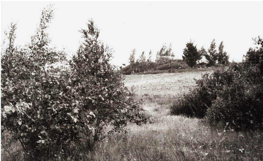
Joonis 4. Kungas Mihhova ja Käpäkülä vahel. Foto: Paulopriit Voolaine, 1960-ndad. (ERM Fk 1508: 47)