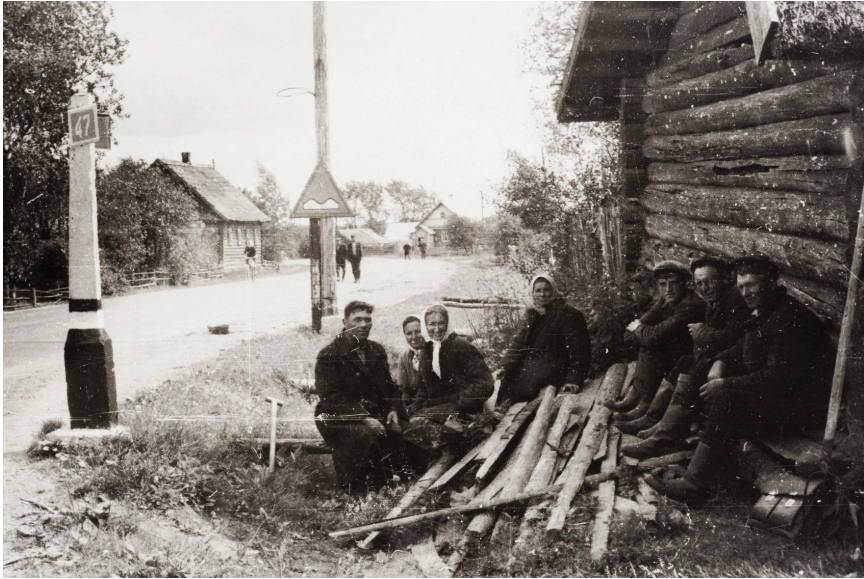
Joonis 3. Vaade Mõiza külale. Esiplaanil kohaliku kolhoosi töötajad. Foto: Paulopriit Voolaine, 1960-ndad. (ERM Fk 1508: 1)