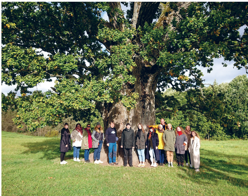
Lõuna-Eesti kultuurigeograafilisel õppeekskursioonil osalejad Urvastes, Tamme-Lauri tamme juures septembris 2022.

Kursuste „Lõunaeesti kultuurigeograafia“ ja „Mulgi keel“ üliõpilaste õppeekskursioon Lääne-Võromaale ja Ida-Mulgimaale. Õppereisi juhendas Taavi Pae.